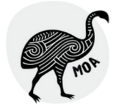
Year 5/6 9-11 years old

팀 이름은 뉴질랜드 토종 새들의 이름을 따으며 각 팀 구성 나이에 따라 학생들을 배정합니다.