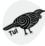
Year 1/2 6-7 years old